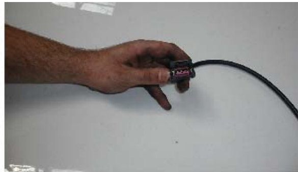
Detalle conector de velocidad