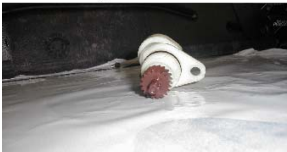
Piñón del captador de velocidad