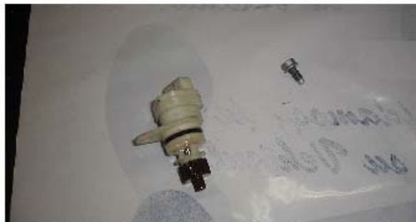
Captador de velocidad y tornillo sujeción