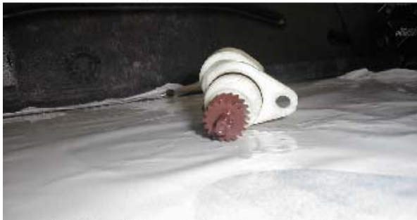
Piñón del captador de velocidad